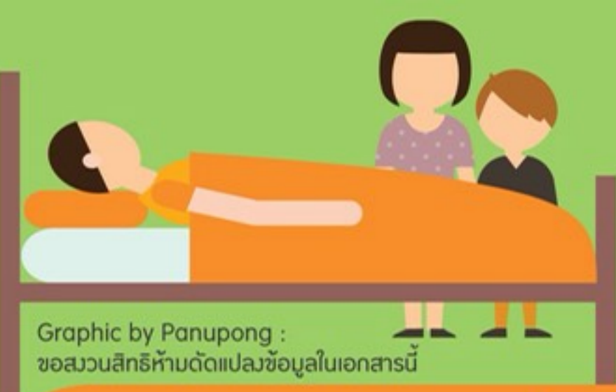
Graphic by Panupong : ขอสงวนสิทธิ์ห้ามดัดแปลงข้อมูลในเอกสารนี้